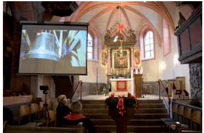
Glockenweihe am 1. Advent

Dekan Tobias Schäfer nahm die offizielle Weihe vor – und beglückwünschte die Kirchengemeinde für alles, was geschehen ist und in die Zukunft hinein von Bedeutung sein wird.