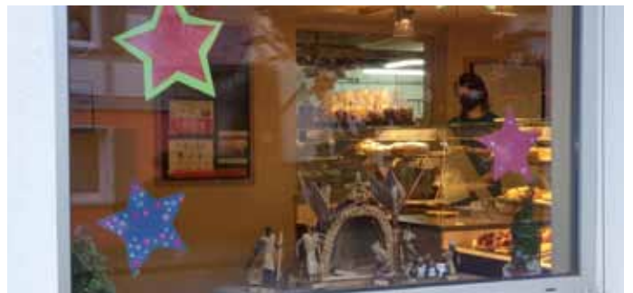
Geschäfte unterstützen den Krippenweg