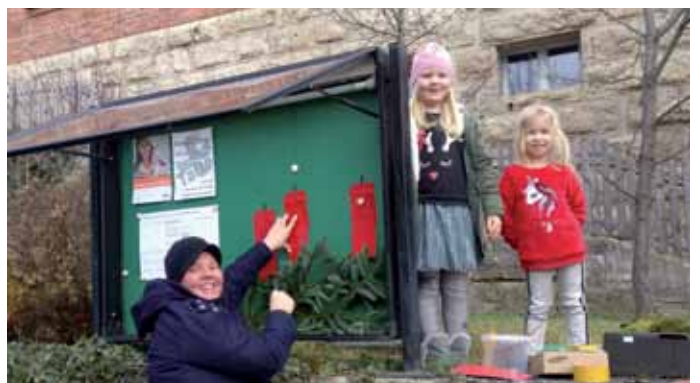
Freundliche Helferinnen gestalten den Schaukasten für die Weihnachtszeit