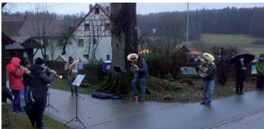
Bläser unterstützen die Gottesdienste im Freien an Heiligabend