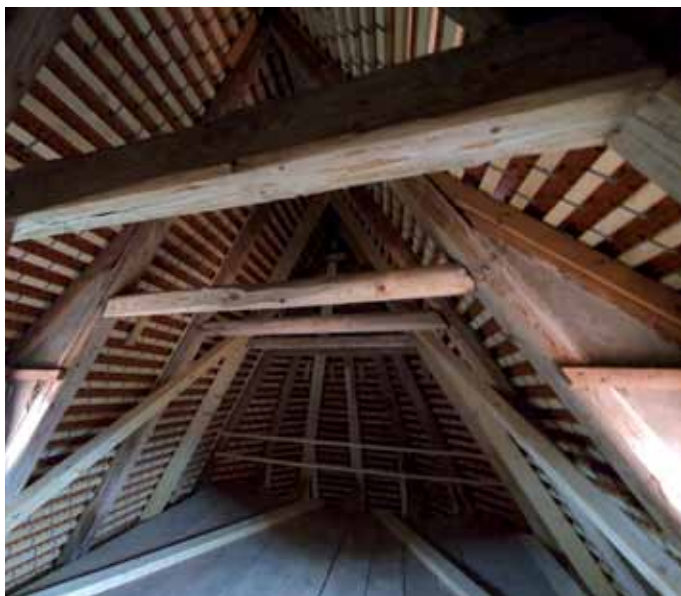
Neue Dachlatten, neue Ziegel und zusätzliche Verstrebungen.

Vieles mit Spannstangen zusätzlich gesichert zudem wurde der komplette Schutt entfernt, der an vielen Balken anlag.