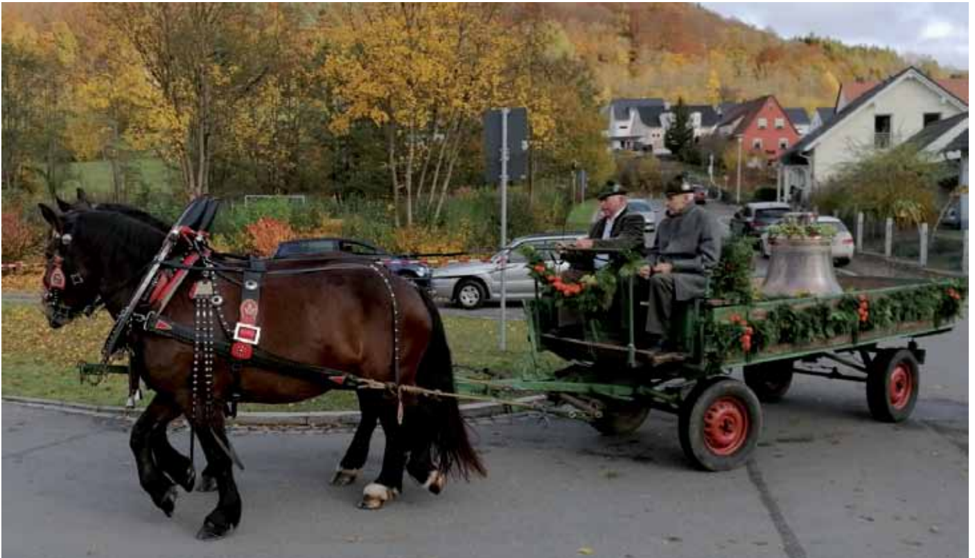
Begrüßung der Glocke am Schulparkplatz am 31.10.2020