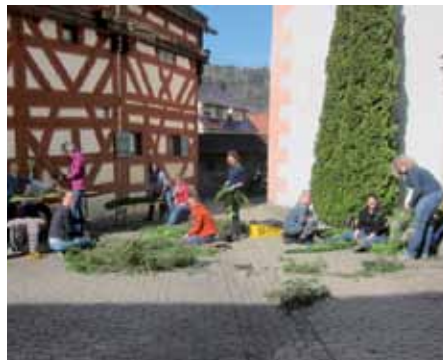
Konfi-Mütter binden Girlanden.