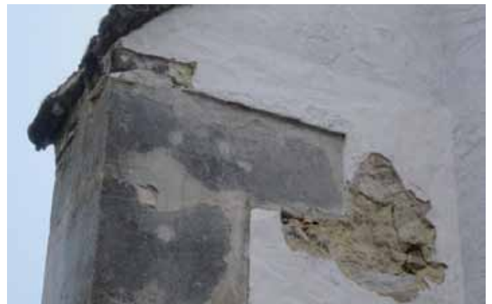
Es bröckelt an vielen Ecken.