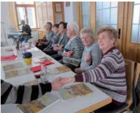
Heiteres im Seniorenkreis zum Fasching.