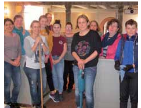
Vor der Konfirmation putzen Präpis und Eltern die Kirche.