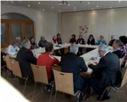
Alle Lektoren aus dem Dekanat trafen sich in Kirchensittenbach.