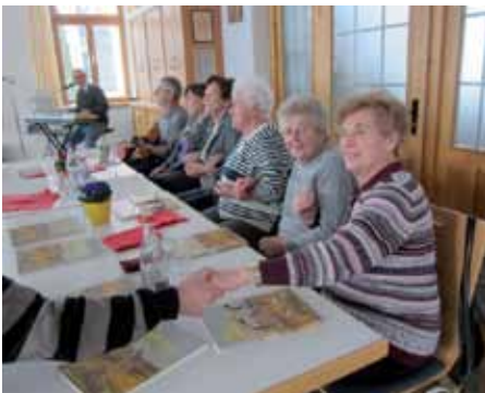
Heiteres im Seniorenkreis zum Fasching.