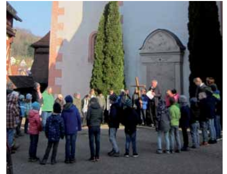
Kreuzweg mit Schülern.