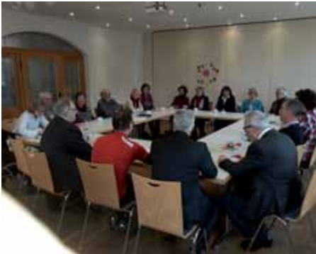
Alle Lektoren aus dem Dekanat trafen sich in Kirchsittenbach.